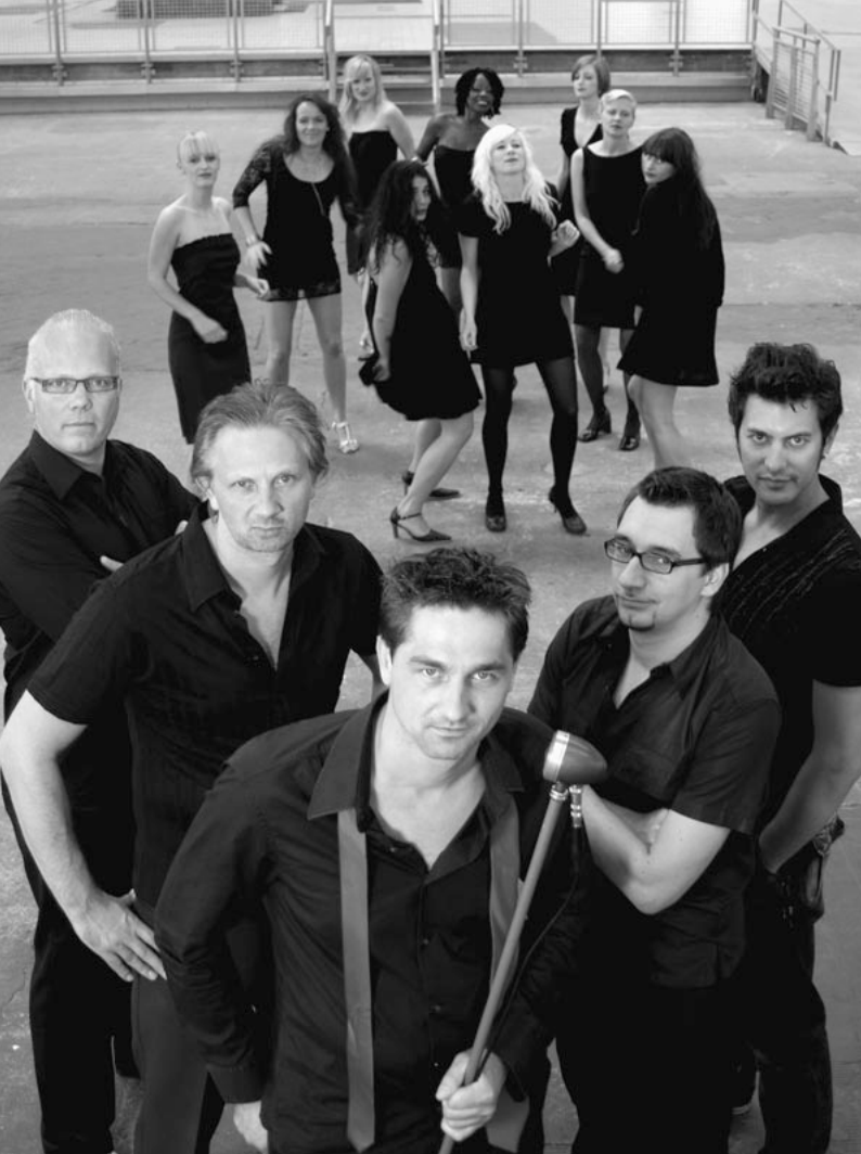
B. B. & The Blues Shacks

Sie gehören auch gewiss zum Jubiläumsjahr